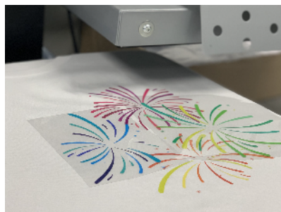
Transferencia realizada con una plancha SEFA